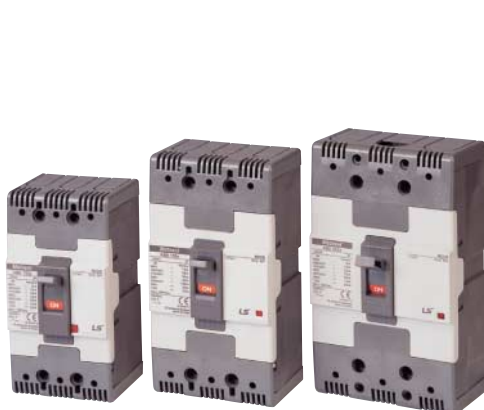
Автоматические выключатели с короткими крышками

Примечание) Крышки выводов для автоматических выключателей в литом корпусе 400AF и 800AF выполнены из акрилового волокна.