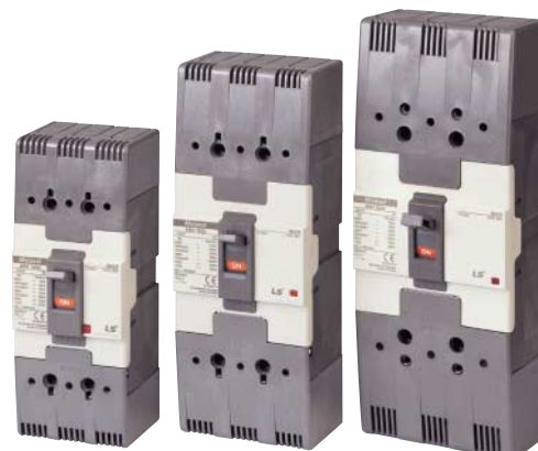
Автоматические выключатели с длинными крышками