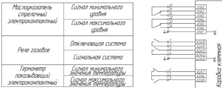
Рисунок Д.1 - Монтаж контрольных кабелей трансформаторов с термометром показывающим электроконтактным, реле газовым и маслоуказателем стрелочным электроконтактным